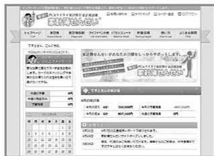
ユーザートップ画面 家計簿せんせいより

平成13年に会社を設立し、社長就任。国有財産中国地方審議委員などの他、広島テレビの情報番組「テレビ派」のコメントーターとしても活躍中。平成19年には金融庁金融知識普及功労者賞受賞。