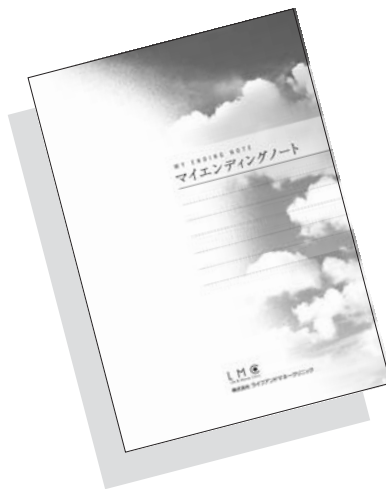
「マイエンディングノート」*弊社オリジナル

エンディングノートとは、自分の人生の終末期における過ごし方や亡くなった後のことについて、自分の歴史、財産、医療や介護・葬儀の希望などの思いをつづるノートです。